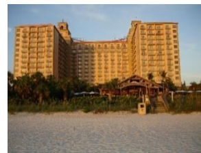
Ritz Carlton Resort, Naples

Das exklusive Ritz Carlton Beach Resort am Ende der Vanderbilt Beach Rd in Nord Naples wird in diesem Sommer knapp 70 Tage für Renovierungsarbeiten geschlossen sein. Am 25. Juni soll mit der Renovierung begonnen werden. Neben einer neuen Fassade für das Gebäude sind auch Veränderungen am Spa Bereich und dem Strandlokal „Gumbo Limbo“ vorgesehen. Die Wiedereröffnung des Resorts ist am 3. September vorgesehen. Das Hotel prüft zurzeit auch, ob ein weiteres Gebäude mit 70 Zimmern Chancen auf eine Genehmigung hätte.